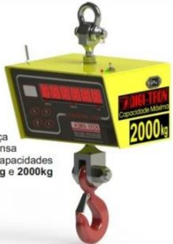
Balança Suspensa para capacidades 1000kg e 2000kg

Possuem Leds indicativos de carga da bateria e tomada externa para carregamento. Display em Led Vermelho Pintura Epóxi.