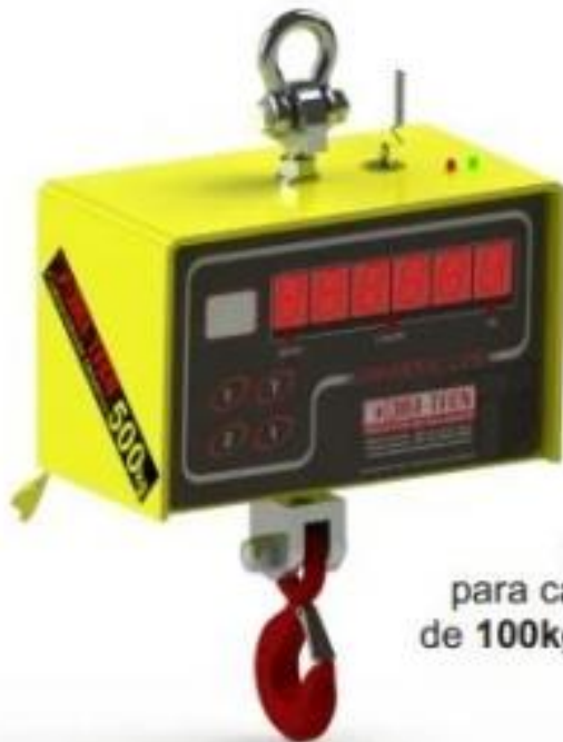
Balança Suspensa para capacidade de 100kg à 500kg